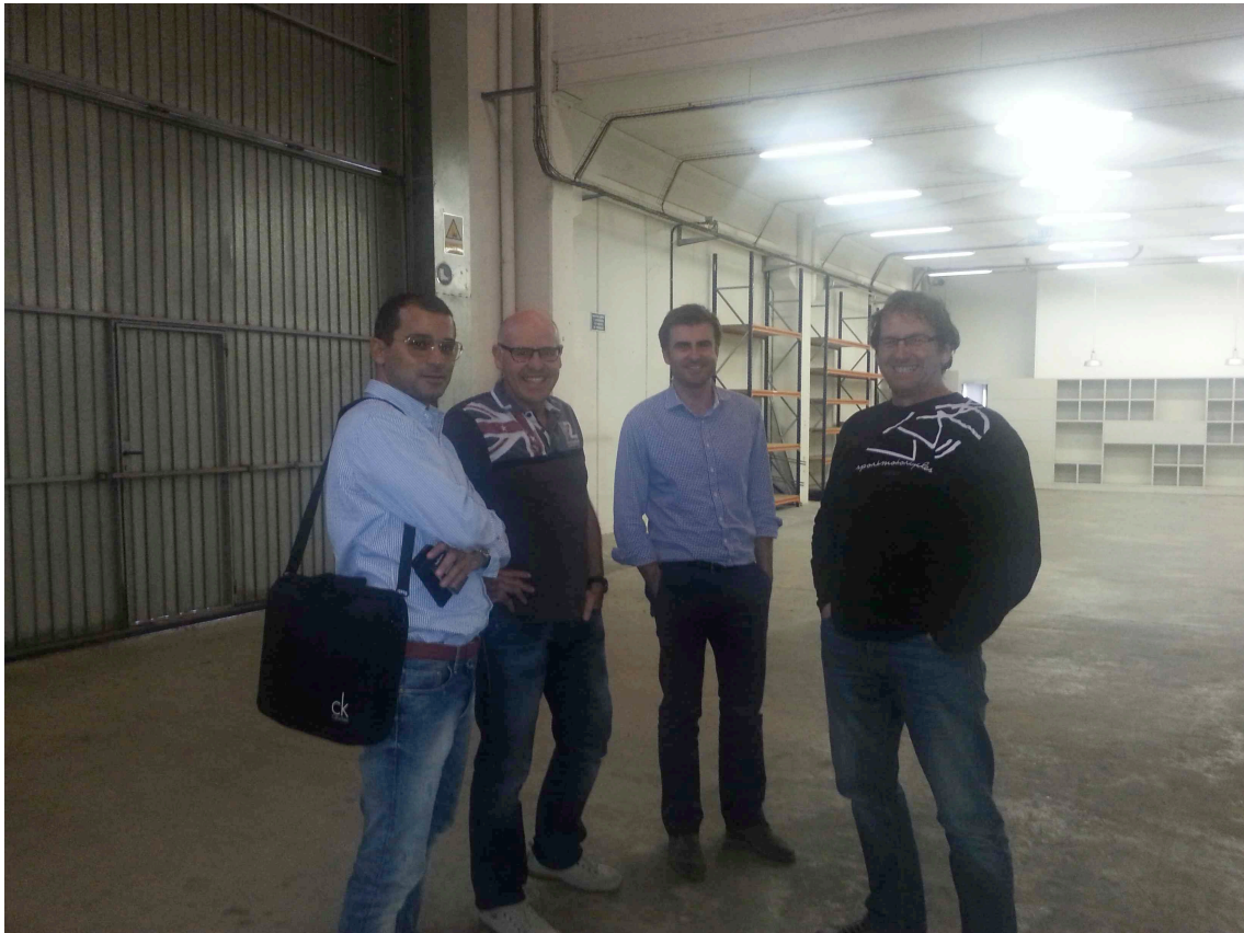
TRS Motorcycles facilities – Manresa