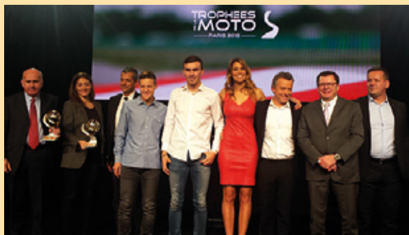
Photo de famille avec tous les récipiendaires.